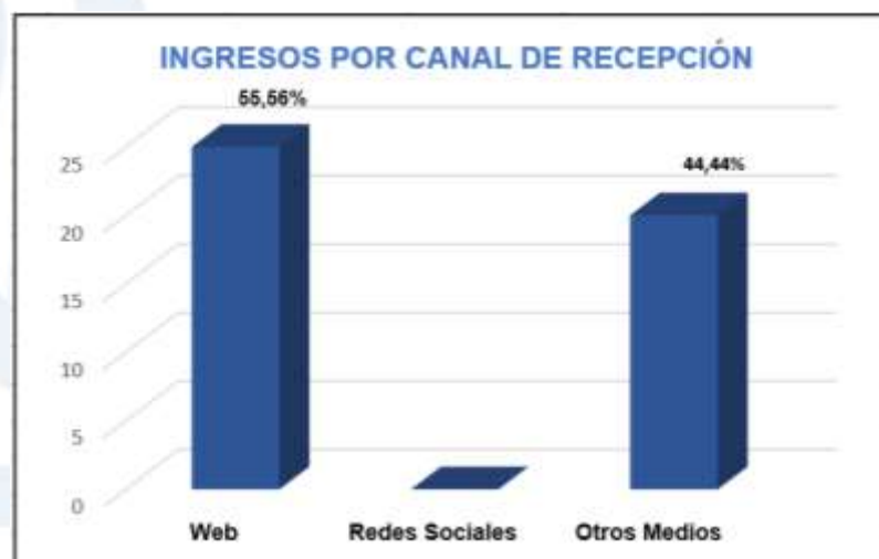
Grafico 1

En la siguiente grafica se puede observar que el canal de interacción mas utilizado por el ciudadano es la web con una participación del 66,67% sobre el total de los ingresos en el primer semestre, seguido del canal Otros Medios (personalmente y correo electrónico), con el 33,33% de participación. Esto indica que los esfuerzos del proceso de PQRDS deberán estar enfocados en la gestión y soporte de los canales tecnológicos.